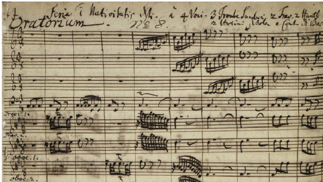
Autograph der ersten Seite des Weihnachtsoratoriums, Staatsbibliothek zu Berlin

Für viele Konzertgänger ist das Weihnachtsoratorium von Johann Sebastian Bach ein jährlich stets wiederkehrender Kantatenzyklus, der zum Weihnachtsfest gehört wie der Tannenbaum oder die Krippe. Die musikalischen Motive des Eingangschores sind einprägsam und vielleicht so populär wie Beethovens „Ode an die Freude“ oder das „O Fortuna“ aus Orffs „Carmina Burana“.